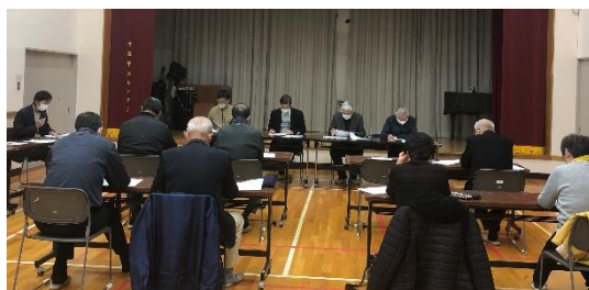
役員会の様子 令和3年11月26日開催

指定管理2期目においても「人が輝き・地域が輝くまちづくり」を地域の皆さんと共に推進してまいります。