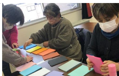
メッセージカード作成中

中里のパワーを感じながら、これからの人生を心豊かに歩んでいただきたいと思います。