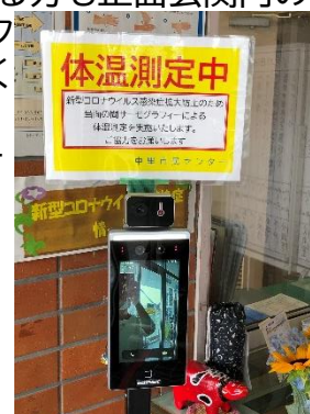
玄関で体温のチェックのご協力を

また、市民センター利用申請をする時は密にならないように部屋の大きさと参加人数の配慮をいただきますようご協力をお願いいたします。