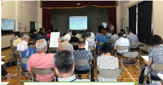
マイ・タイムラインの研修

午後の部は78名の方が参加。内容は水害及び地震発生時に備えたマイ・タイムライン(避難行動計画)についての研修を行いました。マイ・タイムラインとは、これから起こるかもしれない災害に対し、家族構成や地域環境に合わせて、あらかじめ時系列で定めた自分自身の「避難行動計画」です。一関市防災マップをもとに自宅や事業所などの位置と災害時の危険度や災害時に安全に避難できる場所を確認しました。災害が起こる前から避難の準備をし、災害の発生時には警戒レベルや気象状況などの情報をもとに、逃げ遅れないよう行動することが大切です。普段から家族・近隣の方・知人等と連絡を取り合うことも重要です。安全な避難行動ができるよう今回の避難訓練を活用してください。