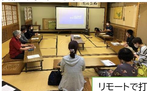
リモートで打合せを実施