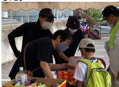
対応に合った非常食を学ぶ

午後の部は78名の方が参加。内容は水害及び地震発生時に備えたマイ・タイムライン(避難行動計画)についての研修を行いました。マイ・タイムラインとは、これから起こるかもしれない災害に対し、家族構成や地域環境に合わせて、あらかじめ時系列で定めた自分自身の「避難行動計画」です。一関市防災マップをもとに自宅や事業所などの位置と災害時の危険度や災害時に安全に避難できる場所を確認しました。災害が起こる前から避難の準備をし、災害の発生時には警戒レベルや気象状況などの情報をもとに、逃げ遅れないよう行動することが大切です。普段から家族・近隣の方・知人等と連絡を取り合うことも重要です。安全な避難行動ができるよう今回の避難訓練を活用してください。