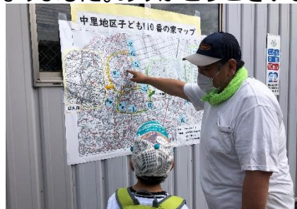
中里地区内子ども110番を知る

中里市民センターでは、6月20日に中里地区防災訓練を実施しました。午前の部は187名の方が訓練に参加。内容は中里地区に昨年度末に新たに設置した子ども110番の家を訪問し、子ども110番の役割の説明を受け、緊急時に躊躇なく避難できるよう顔がつながる関係性を築くものです。また、中里市民センターに中里地区全体の子どもの110番のマップを掲示し、中里地区全体の設置位置を確認しました。災害時に危険性が高まる場所では、担当者から原因や対応策などの説明を受けました。中里市民センターでは、感染症対策や非常時持ち出し品の確認、家でもできる応急処置の方法、非常食の備え、起震車による地震の疑似体験など災害時に対応できる様々な訓練を実施しました。訓練に参加した方からは「中里地区全体の子どもの110番の役割と設置者が分かった」「安心できる中里だと思う。設置者に感謝」「非常時持ち出し品の準備が足りていなかった。家族分、徐々に揃えていきたい」「家にあるものを使った処置方法を学ぶことができた」「行動食や避難食など日数に合せた非常食の量や内容を知った」などの感想を寄せていただきました。子ども110番設置者はじめ、担当者の方々には大変お世話になりました。ありがとうございました。