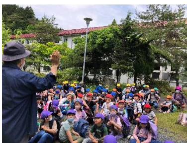
中学校の歴史について学ぶ

中里放課後子ども教室では、5月24日(運動会振替)に中里探検を行いました。1年生21名を含む77名の児童が参加し、中里小学校～蘭梅民区～(通称)地獄坂～旧中里中学校～砂防ダム～稲荷神社等を巡りました。小学校近辺が地すべり地帯であること、砂防ダムの働き、害獣(イノシシ)の被害が里山まで及んでいることなどを見学しました。昼食後は、小学校の遊具の所で「空飛ぶ団子」を実施しました。ロープで籠(中に団子が入っている)を山の斜面を利用して移動させました。滑車やロープの種類によってスピードが違ふことなどを楽しく学びました。