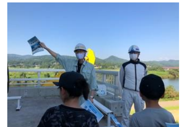
大林水門・堤防の工事を見学