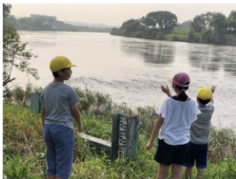
北上川との合流地点を見学

《お知らせ》 一昨年・昨年のぼうさい探検マップの取組みが放映されます。 ごきげんテレビ（テレビ岩手）9月4日（金）予定 どうぞご覧ください。