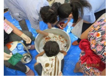
金魚すくいに挑戦！