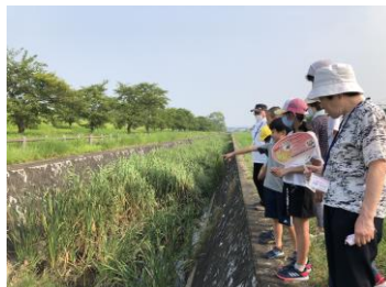
内水排水についても学びました