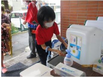
感染症対策 玄関で手洗い

浴衣姿の子ども達がとても多く、「とても楽しみにしてきた」とはじける笑顔が溢れていました。