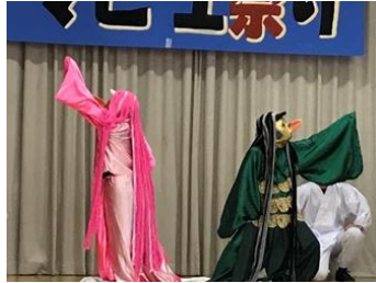
コロナ退散祈禱 アマビエの舞